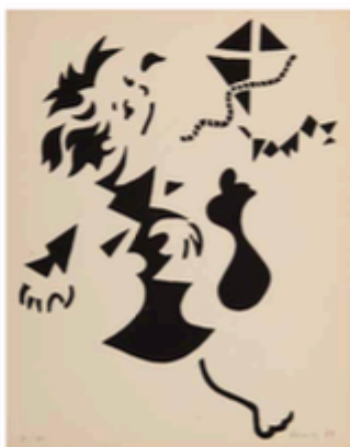
1. MENINO COM FÚTBOL (1944) Cândido 27,5 x 25,3 cm Edição de autor. Tiragem anotada: 50 exemplares. Nota: Gravura realizada para uma edição especial do álbum #12 Dezembro, 1948.