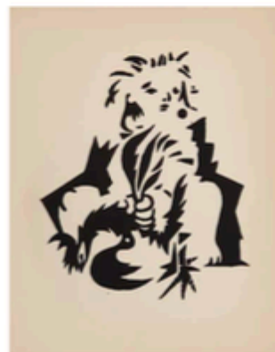
2. O GALO MORTE (1944) Cândido 27,5 x 25,3 cm Tiragem descorrelata. Exemplares: 1948, 3-75 Exposição Geral de Artes Plásticas, 1964, Lisboa, cat. n.º 206. Nota: O Menino com um galo morto, 1948 (desenho inédito), Catálogo Raisonné I, n.º 42.