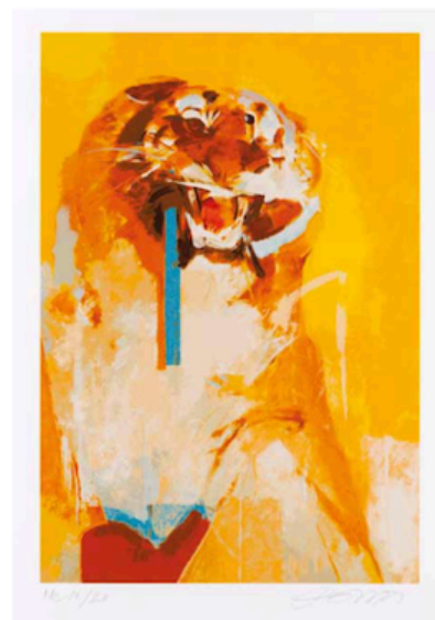
25. TIGRE 1980-2014 Serigrafia 54,8 x 37,8 cm (mancha); 70 x 50 cm (papel) Atelier Centro Português de Serigrafia, Lisboa. Edição Milenium BCP. Tiragem: 150 exemplares, 25 provas de artista (PA, LXXXX) e 25 provas fora do mercado (HC). Nota: Cf. Tigre, 1980 (leu sobre tela), Catálogo Raisoné II, n.º 309.