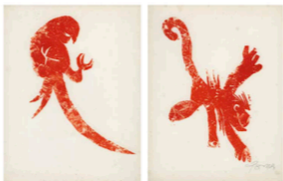
11. PARLAREO (1942) 12. PARLAREO (1942)