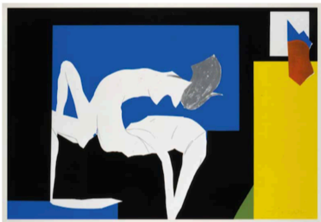
9. LA CHAMBRE NOIRE 1976 Serigrafia a 7 cores 76,3 x 111 cm (mancha); 80 x 118,5 cm (papel) Atelier Michel Cassa, Paris. Edição Art Moderne, Paris / Galerie Belleschasse, Paris. Tiragem: 100 exemplares e 30 provas de artista (EA XXXX) Nota: Cf. La Chambre Noire, 1976 (colagem e tinta acrílica sobre papel), Catálogo Raisoné II, n.º 143.